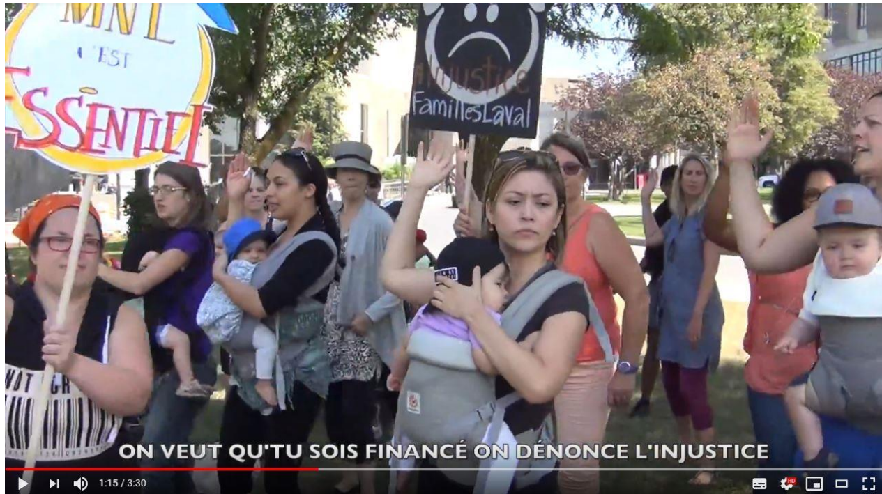
30 août 2017 : manifestation des familles devant la Cité de la santé.

2016-17/ L'année est marquée par une mobilisation importante pour la survie de MNL avec une campagne de financement, la création de la Coalition Pour nos bébés et le dépôt d'une pétition à l'Assemblée nationale. Le maire de Laval, Marc Demers, appuie publiquement le projet par communiqué et par la réalisation d'un message vidéo. Grâce à la mobilisation, aux contributions bénévoles, aux donateurs et un budget discrétionnaire du ministre de la santé, MNL a pu continuer à donner ses services toute l'année, mais le financement récurrent lui est toujours refusé par le ministre Gaétan Barrette.