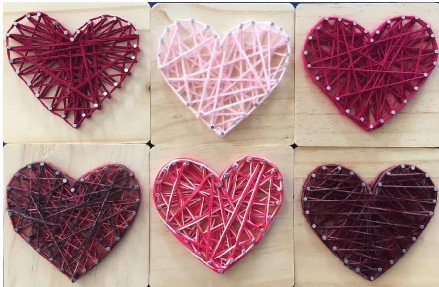
Projets réalisés lors d'une des pauses créatives animées par Esther Meloche, administratrice au Conseil d'administration et bénévole.

Mieux-Naitre à Laval a pour mission de soutenir les parents, les mères en particulier, dans le but de les aider à vivre la venue d'un enfant de la façon la plus harmonieuse et satisfaisante possible, en leur offrant des services en périnatalité, incluant ceux des sages-femmes.