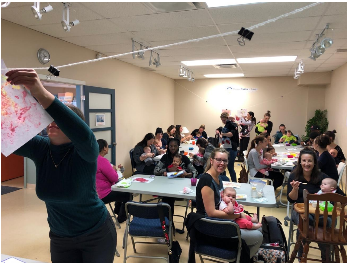
Activité de peinture adaptée pour bébé lors de la Grande semaine des tout-petits – 21-11-2018.