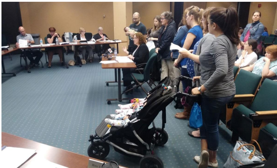
Les familles et Mieux-Naitre à Laval interpellent le CA du CISSS de Laval, 14 juin 2018.

Mère de jumeaux de 6 mois, problème de santé, urticaire : Pourquoi dans une grande ville comme Laval, je n'ai pas eu accès au service de relevailles autant que j'en avais besoin alors que je les aurais eus sans attendre 2 mois et je les aurais encore si j'étais dans les villes autour de Laval?