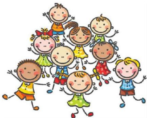
Table en Petite enfance de Ste-Rose &

AVENIR D'ENFANTS DES COMMUNAUTÉS ENGAGÉES