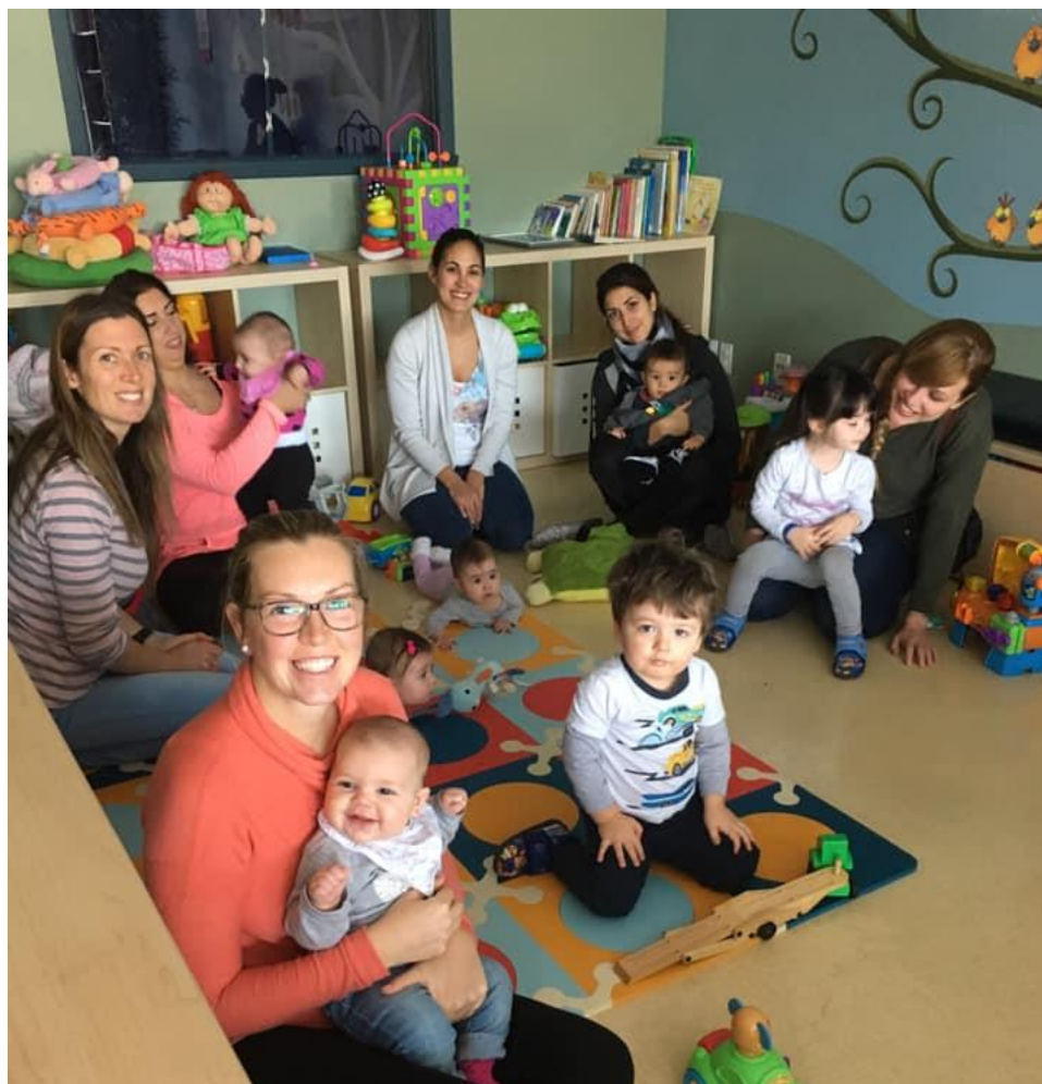
Quelques mères, bébés et bambins lors de la Grande semaine des tout-petits – 23-11-2018.