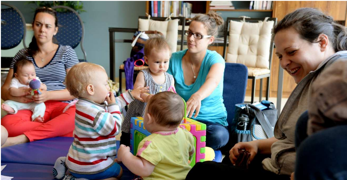
Café-causerie du mardi matin

Mieux-Naitre à Laval a pour mission de soutenir les parents, les mères en particulier, dans le but de les aider à vivre la venue d'un enfant de la façon la plus harmonieuse et satisfaisante possible, en leur offrant des services en périnatalité, incluant ceux des sages-femmes.