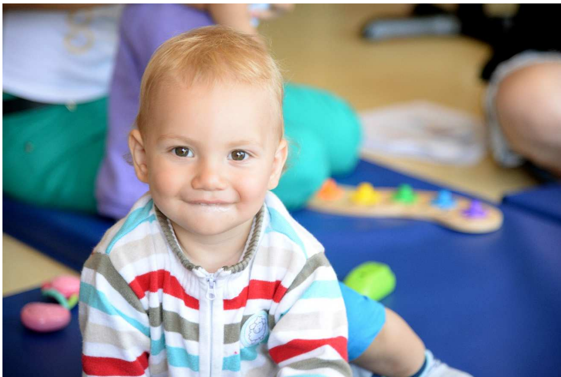
Nancy Millette, A2 Photographes