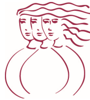
Table de concertation de Laval en condition féminine

La Table de concertation de Laval en condition féminine (TCLCF) est un regroupement régional travaillant avec ses membres à l'amélioration de la qualité et des