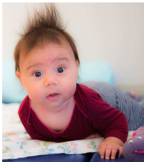
Capteuse de vie photographie par Valérie Turcotte

RCR – Faire face aux urgences est une formation de quatre heures conçue pour habiliter les parents à intervenir en cas d'urgence médicale chez les adultes, les enfants et les bébés. Au terme du cours de réanimation, les participants auront appris comment réagir et les gestes à poser avec une personne inconsciente, en cas d'étouffement ou pour débarrasser et dégager des voies respiratoires. Le cours permet l'obtention d'une carte de certification de la Fondation des maladies du cœur et de l'AVC.