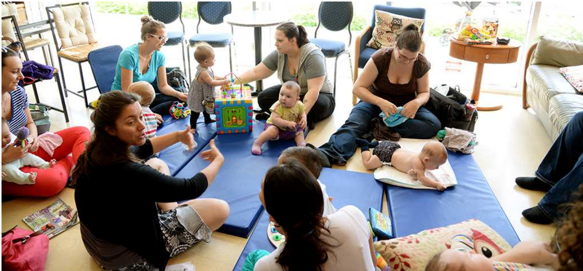
Nancy Millette, A2 Photographes

Des bénévoles assurent l'animation et l'accueil des causeries. La promotion est faite via la section Événements de notre page Facebook et avec nos partenaires.