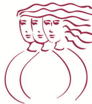
Table de concertation de Laval en condition féminine

MNL est membre de la TCLCF et en respecte les valeurs.