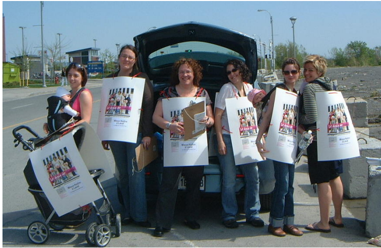
5 mai 2010, l'escouade de MNL donne de l'information sur la pratique sage-femme aux passants au Métro Montmorency.

10 mai 2010 : Les Lavalloises veulent avoir accès à des sages-femmes , article de Geneviève Fortin, publié dans le Courrier Laval, relatant les activités de MNL du 5 mai au Métro Montmorency.